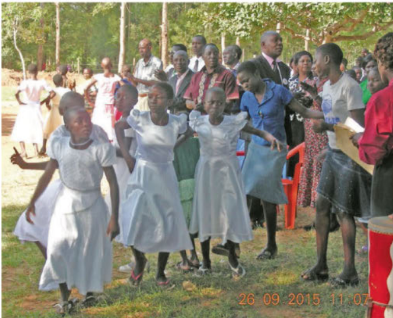
Kids leading the Offertory Dance at outdoor Mass