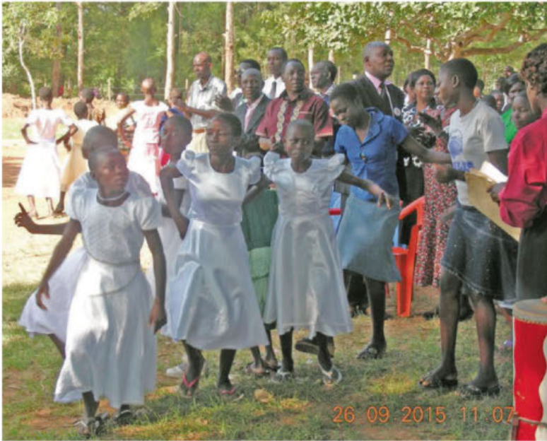
Niños dirigiendo el baile del Ofertorio en la Misa al aire libre