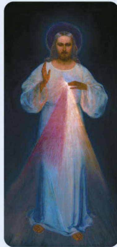
Divine Mercy, Eugeniusz Kazimirowski, 1934, Wikipedia

On the third Friday of every month, after the 12:10 pm Mass, we pray the Chaplet of the Divine Mercy. Jesus promised Faustina, "When they say this Chaplet in the presence of the dying, I will stand between My Father and the dying, not as the just judge, but as the Merciful Savior.